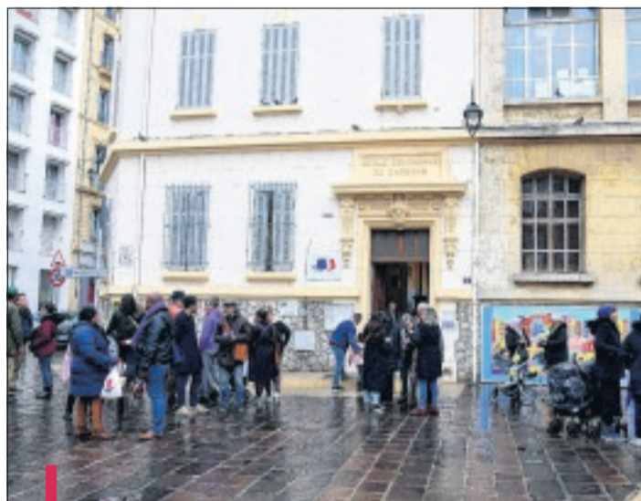
Une réunion était prévue à l'école François Moisson (2 e ) sur les précautions à prendre. Elle a été annulée.

Du coup, la réunion prévue à l'école François Moisson (2 e ), destinée à informer parents, enseignants et personnels sur la maladie, a été annulée. Comme dans plusieurs autres établissements scolaires marseillais. Dans la soirée de dimanche, les chefs d'établissements ont en effet reçu une note du ministère de l'Éducation nationale relative à la propagation de cette pathologie. "Le virus commence à circuler dans certaines parties du territoire national, il n'y a plus de raison de confiner des personnes revenant de zones exposées à une circulation active